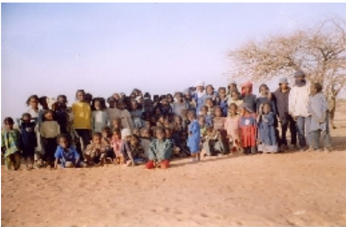
La première année de primaire en 2006