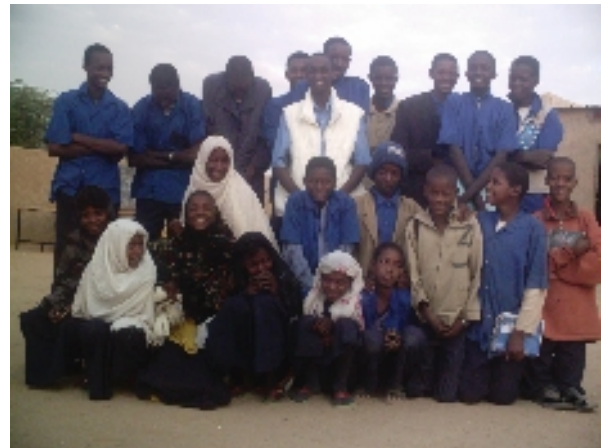
En 2012 21 collégiens