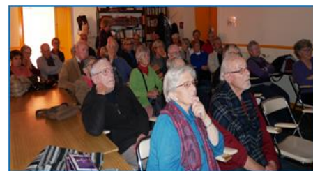
Une partie de la salle lors de l'AG