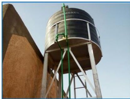
Etat attendu du château-d'eau

L'eau arrive au robinet à l'internat grâce au raccordement au réseau urbain par nos amis de NINAFRI (Belgique) et MEMS a payé l'installation d'un petit château d'eau dans l'internat pour sécuriser la distribution de l'eau aux élèves.