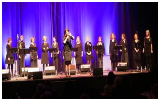
Les concarnoises des Whoops et Zingarelles lors du concert pour Mil Espoir Mille Savoirs

Le repas suivi du concert des Whoops, groupe féminin de jazz vocal, et de la chorale des Zingarelles, a ravi les participants.